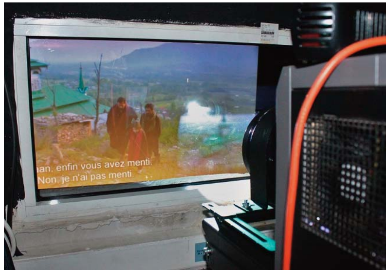
Bajrangi Bhaijaan depuis la salle de projection des Arcades.