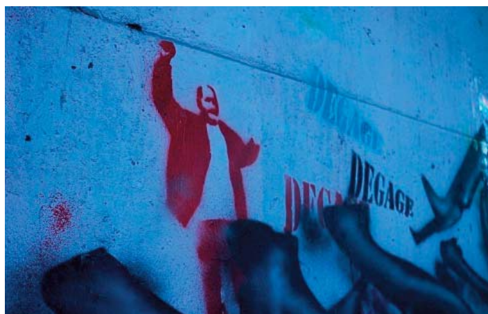
À Tunis, les murs sont marqués par la contestation du peuple.

Thème central du film, c'est cette jeunesse tunisienne première victime du régime oppressant de Ben