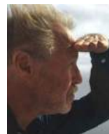
Nicolas Philibert réalisateur