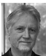
Les McLaren réalisateur