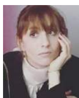
Lolita Chammah actrice