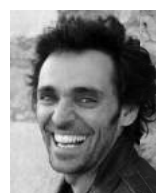
Alexandre Moix écrivain, journaliste et réalisateur