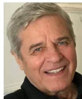
Jean Sorel acteur