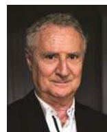
Daniel Prévost acteur