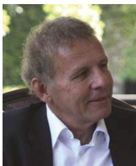
Patrick Poivre d'Arvor journaliste, animateur tv et radio, écrivain