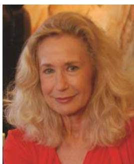
Brigitte Fossey actrice