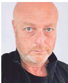
Gérard Krawczyk réalisateur, scénariste et écrivain