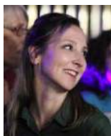
Audrey Lamy actrice et humoriste