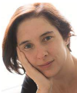
Elsa Diring réalisatrice, scénariste