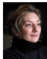
Corinne Masiero Actrice