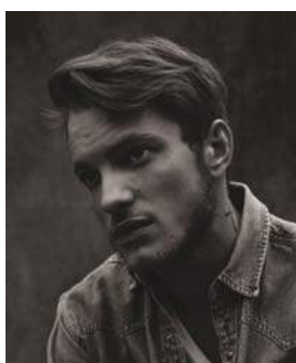
Paul Bartel acteur