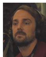
Louis-Julien Petit réalisateur