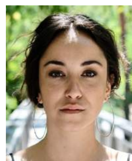
Coline D'Inca actrice