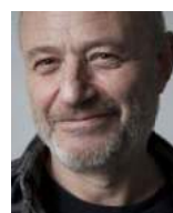
Edouard Waintrop critique