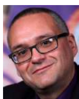
Grégory Marouzé critique, rédacteur, auteur et réalisateur