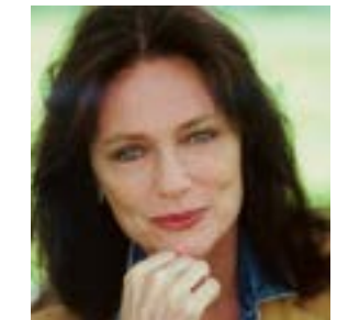
JACQUELINE BISSET Présidente du jury Actrice