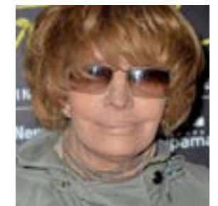
NADINE TRINTIGNANT Réalisatrice & Actrice